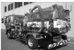
パワフルマスター (強力吸引車)