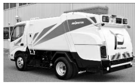
パックマスター (回転式塵芥車)