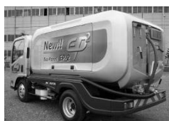
EP2 (バキュームカー) (衛生車)