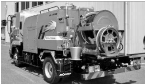
ハイプレクリーナー (高圧洗浄車)